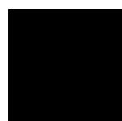
RAL 9005 Negro (N)